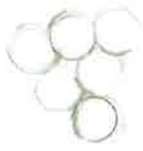
Abbildung 2: Markierung der Adaptionen im Beschlussplan