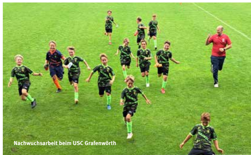
Nachwuchsarbeit beim USC Grafenwörth