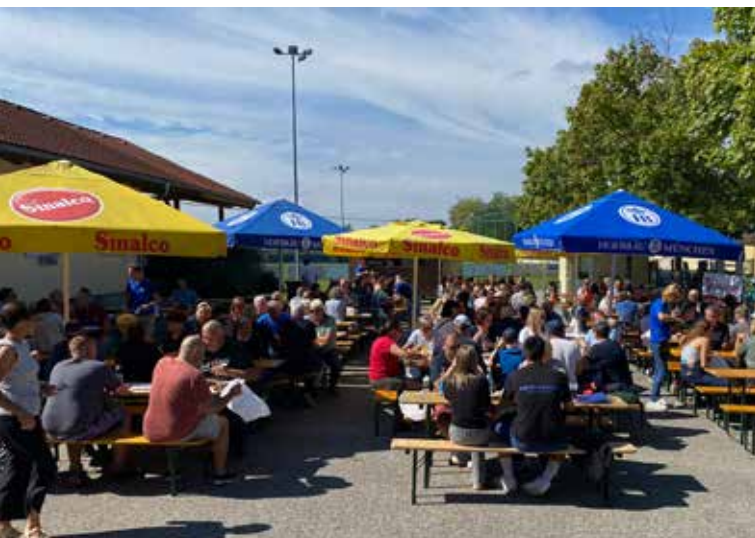
Der traditionelle Steckerlfisch des USC Grafenwörth

Der beliebte Steckerlfisch findet am Donnerstag, 14. Mai 2026, statt. Bei Schlechtwetter wird die Veranstaltung auf Sonntag, 17. Mai 2026, verschoben.