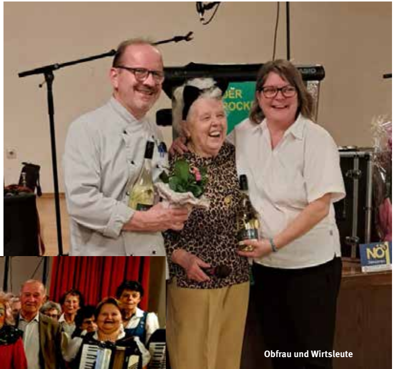
Obfrau und Wirtsleute

Bei der Tombola gab es viele schöne Preise zu gewinnen, die großzügig von den Gewerbebetrieben der Umgebung und von Privatpersonen gespendet wurden. Viel zu schnell verflog der schöne Nachmittag.