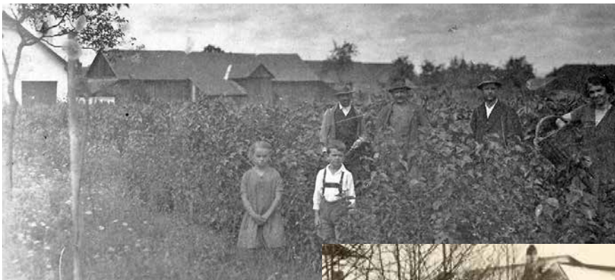
Schulacker 1930 – Seidenraupenzucht neben dem Milchhaus

Nachdem die monatliche Liefermenge der Milch durch Umstrukturierungen in der Landwirtschaft stetig abgenommen hatte, wurde die Milchgenossenschaft 1977 aufgelöst und das Gebäude formell an die Tiefkühlgenossenschaft verkauft.